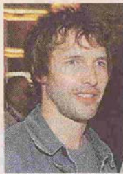
Auf der Adidas-Party: James Blunt

Etliche Gäste wie Leinwandstar Daniel Brühl , erschienen später als erwartet (er kam gegen 1.30 Uhr), viele mußten zunächst durch den Autostau und ein ohrenbetäubendes Hupkonzert der Fußballfans in den umliegenden Straßen, ehe sie endlich vor dem E-Werk an der Wilhelmstraße angelangt waren. „Das ist einfach eine Superstim-