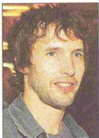
Auf der Adidas-Party: James Blunt