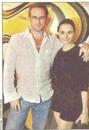
„Poseidon“-Darsteller Josh Lucas und Mia Maestro